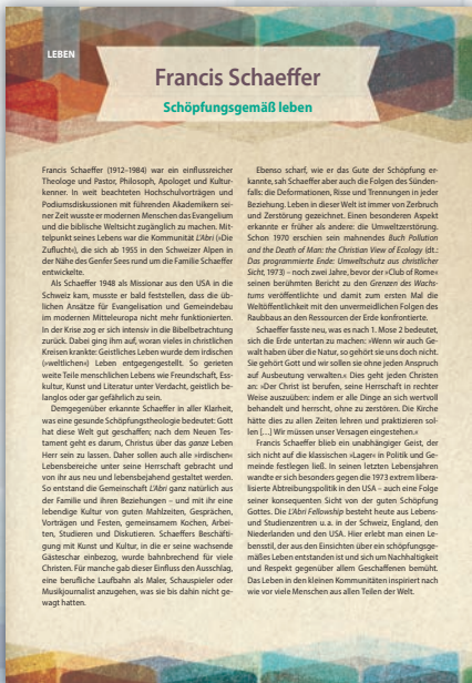
Francis Schaeffer (1912-1984) war ein einflussreicher Theologe und Pastor, Philosoph, Apologat und Kulturkammer. In weit beachteten Hochschulvorträgen und Podiumsdiskussionen mit führenden Akademikern seiner Zeit wusste er modernen Menschen das Evangelium und die biblische Weltanschauung zugänglich zu machen. Mittelpunkt seines Lebens war die Kommunität Cedar (Die Zufallschleife), die sich ab 1955 in den Schweizer Alpen in der Nähe des Genfer Sees rund um die Familie Schaeffer entwickelte. Als Schaeffer 1948 als Missionar aus den USA in die Schweiz kam, musste er bald feststellen, dass die üblichen Ansätze für Evangelisation und Gemeindebau in moderner Mitteleuropa nicht mehr funktionierten. In der Krise zog er sich inszenen in die Bibelbesuchung zurück. Dabei ging ihm auf, wozu vieles in christlichen Kreisen krankte: Geistliches Leben wurde dem irdischen (weltlichen) Leben entgegengesetzt. So gerieten weite Teile menschlichen Lebens wie Freundschaft, Esskultur, Kunst und Literatur unter Verdacht, geistlich belanglos oder gar gefährlich zu sein. Demgegenüber erkannte Schaeffer in aller Klarheit, was eine gesunde Schöpfungstheologie bedeutet: Gott hat diese Welt gut geschaffen, nach dem Neuen Testament geht es darum, Christus über das ganze Leben Herr sein zu lassen. Dabei sollen auch alle irdischen Lebensbereiche unter seine Herrschaft gebracht und von ihr aus neu und lebensbejahend gestaltet werden. So entstand die Gemeinschaft Cedar ganz natürlich aus der Familie und ihren Beziehungen - und mit ihr eine lebendige Kultur von gutem Malzbraten, Gesprächen, Vorträgen und Festen, gemeinsamen Kirchen, Arbeiten, Studieren und Diskutieren. Schaeffers Beschäftigung mit Kunst und Kultur, in die er seine wachsende gläubige Anhängerschaft einbezog, wurde bald ein Vorbild für viele Christen. Für manche gab dieser Einfluss den Ausschlag, eine berufliche Laufbahn als Maler, Schauspieler oder Musikjournalist anzugehen, was sie bis dahin nicht gewagt hatten.

Viele Orte aus biblischer Zeit sind dem heutigen Leser unbekannt. Doch wenn wir uns die Geografie der Bibel anschauen, entdecken wir, dass die damalige Welt gar nicht so viel anders war als unsere heutige Welt. Die Ortsbeschreibungen stellen den betreffenden Ort auf der Landkarte dar und bieten Informationen über ihn und über das Leben der Menschen, die dort wohnten.